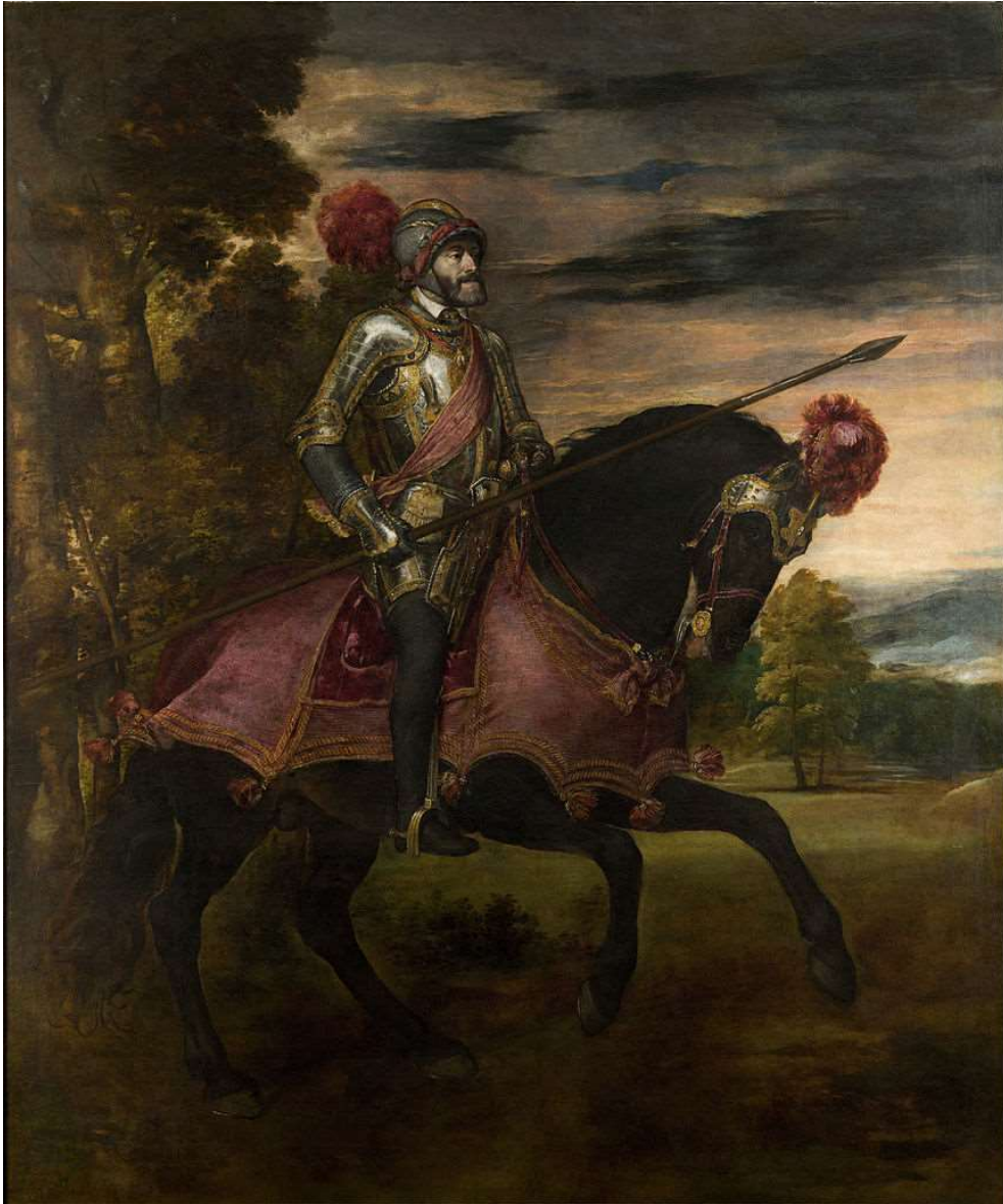
Carlo V alla Battaglia di Mühlberg (1547), Tiziano.

ogni tentativo è inutile e che la guerra è inevitabile. Scoppia così la Guerra Smalcaldica tra l'imperatore e la Lega di Smalkalda (che raduna gran parte dei principi protestanti tedeschi).