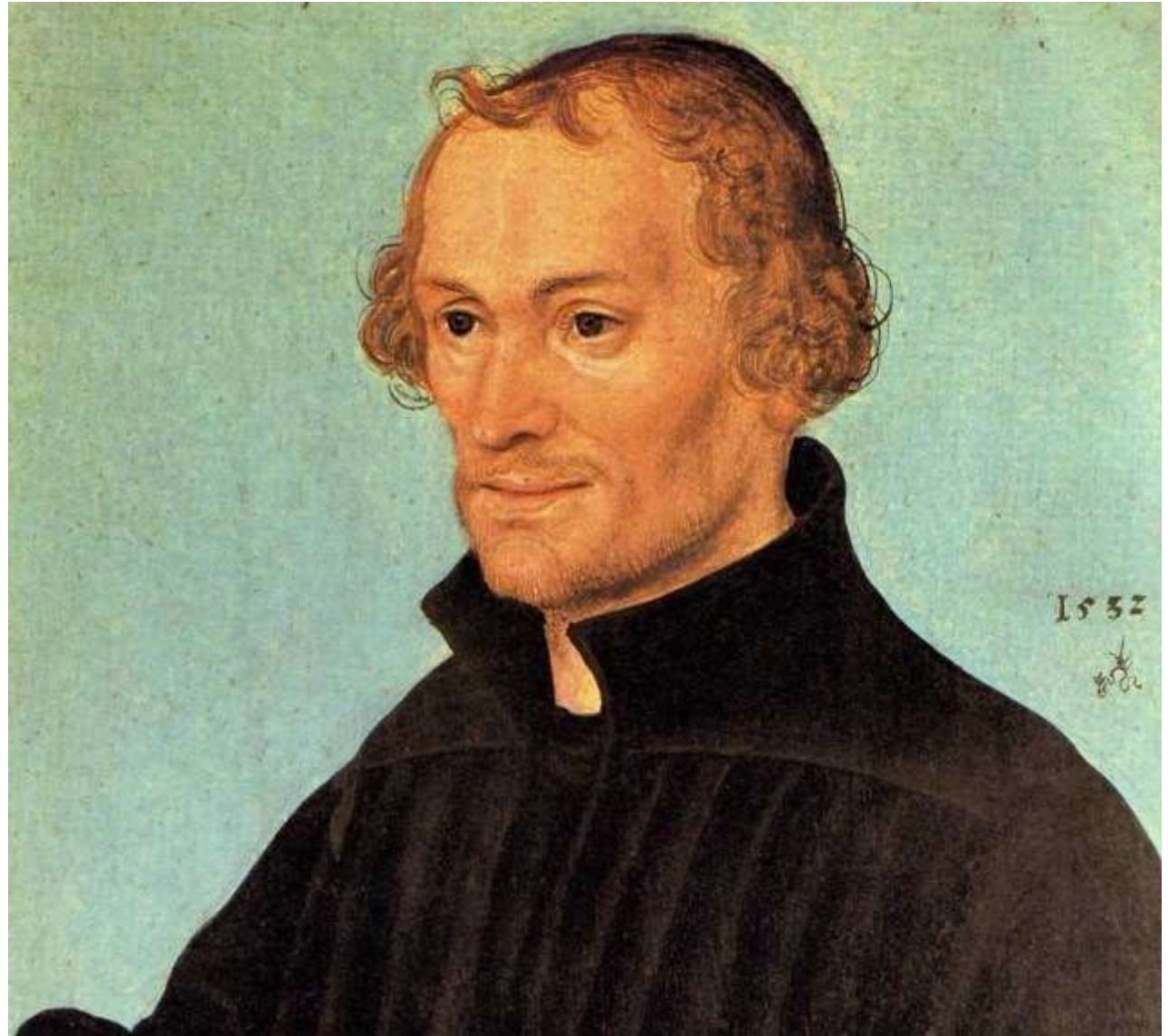
Ritratto di Philipp-Melanchthon (1532), di Lucas Cranach.