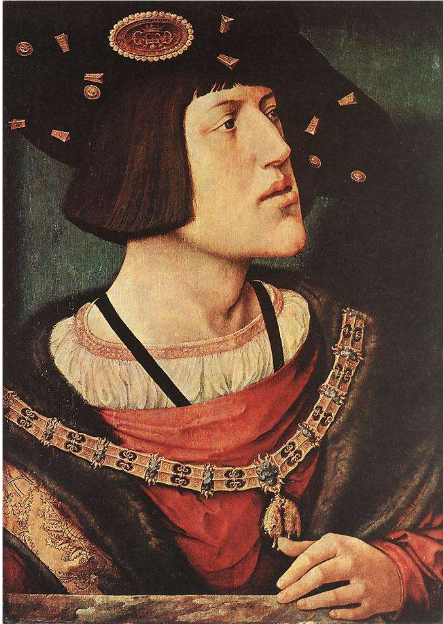
Carlo V, ritratto di Bernard van Orley (Budapest Museum of Fine Arts), tra il 1519-1520. Durante la Dieta di Worms aveva la barba, ma il suo aspetto giovanile non dovrebbe essere molto diverso. Durante la Dieta di Wors compì i 21 anni.