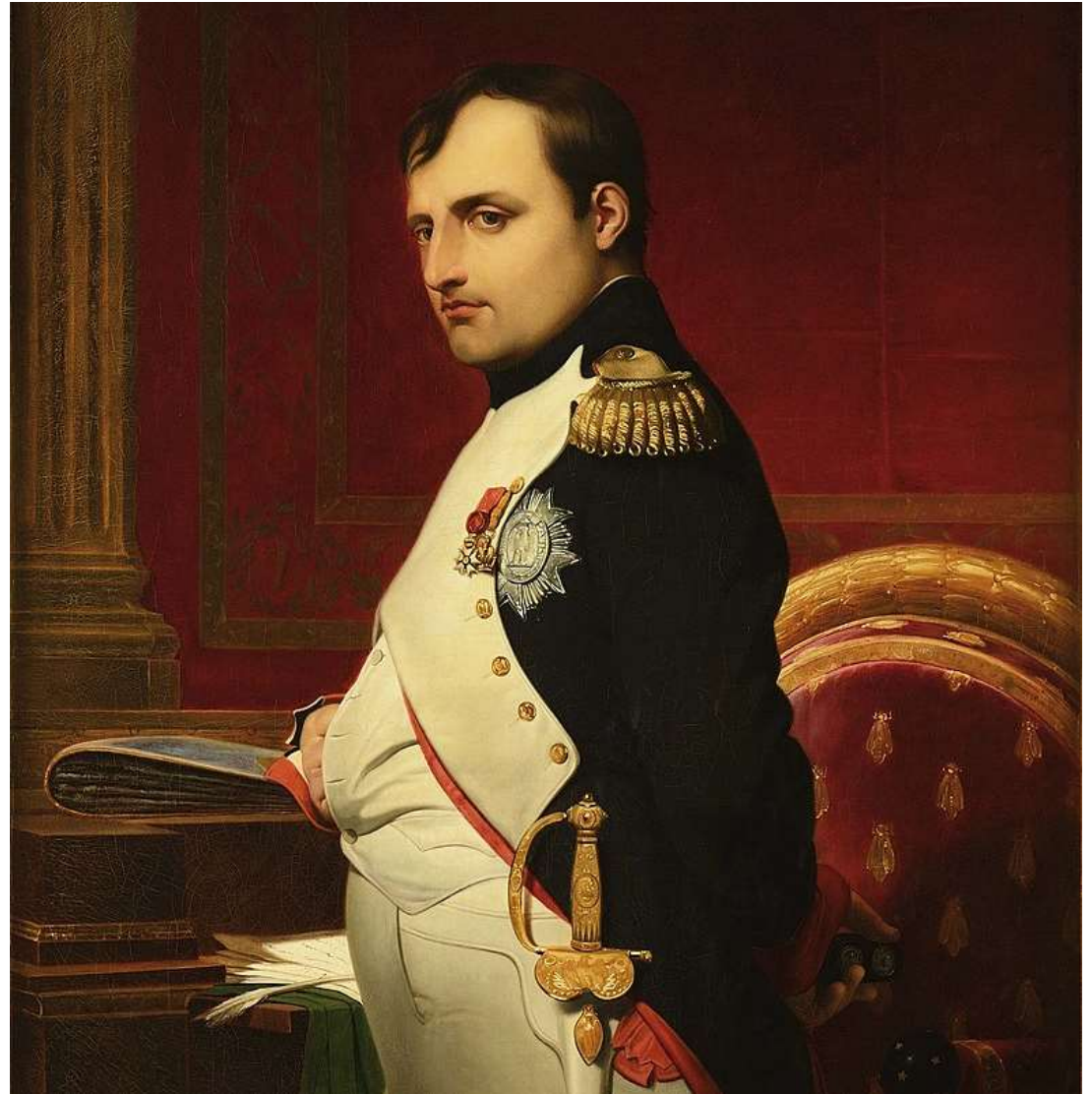
Napoleone Bonaparte, imperatore, in 1807 (Paul Delaroche)