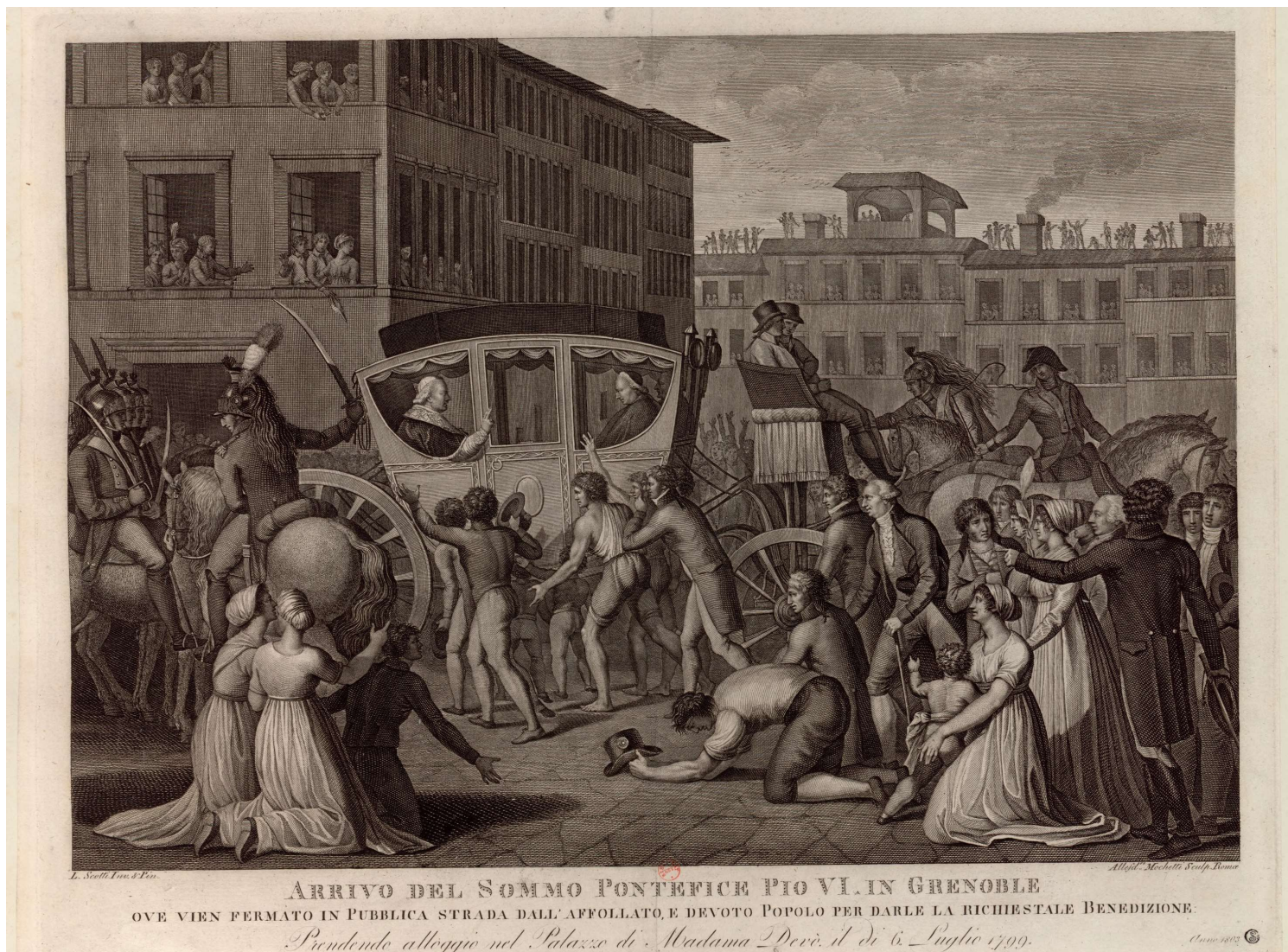
Pio VI, deportato, di passaggio per Grenoble.