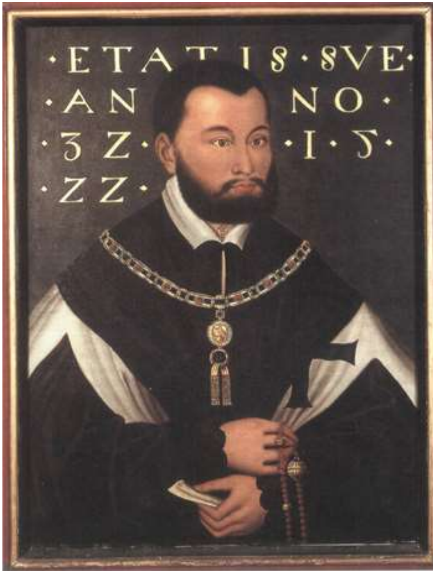
Ritratto di Albrecht von Brandenburg-Ansbach (1490-1568), Alberto di Prussia, ultimo Gran Maestro dell'Ordine Teutonico. (dipinto di Hans Krell, 1522)

riforma, secolarizza l'ordine e s'impadronisce dei territori dell'Ordine, che diventeranno il Ducato di Prussia.