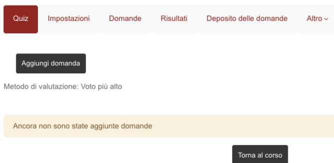
Figura 7: Visualizzazione quiz da parte dell'utente

Cliccando sull'icona Salva e visualizza , questo è ciò che l'utente vede.