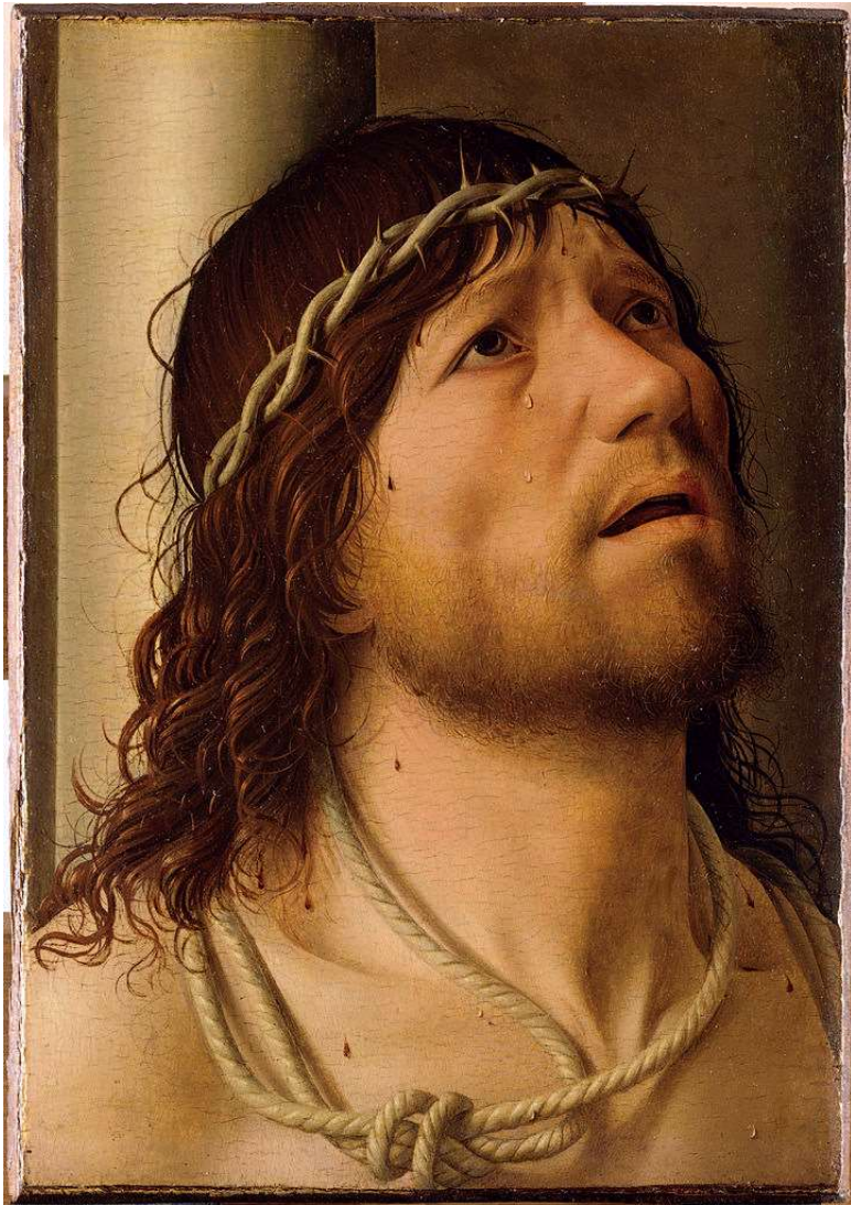
Cristo alla colonna (1476 circa), Antonello da Messina.