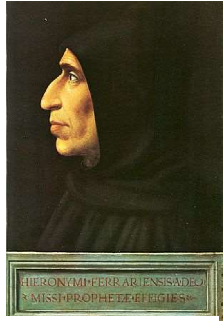
Girolamo Savonarola, domenicano, scomunicato e condannato a morte, oggi è stato riabilitato ed è in processo di beatificazione.