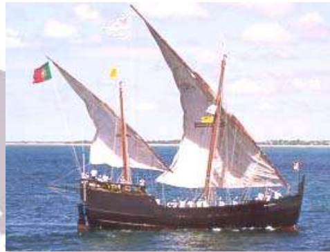
Una caravella, nave usata nelle esplorazioni geografiche.