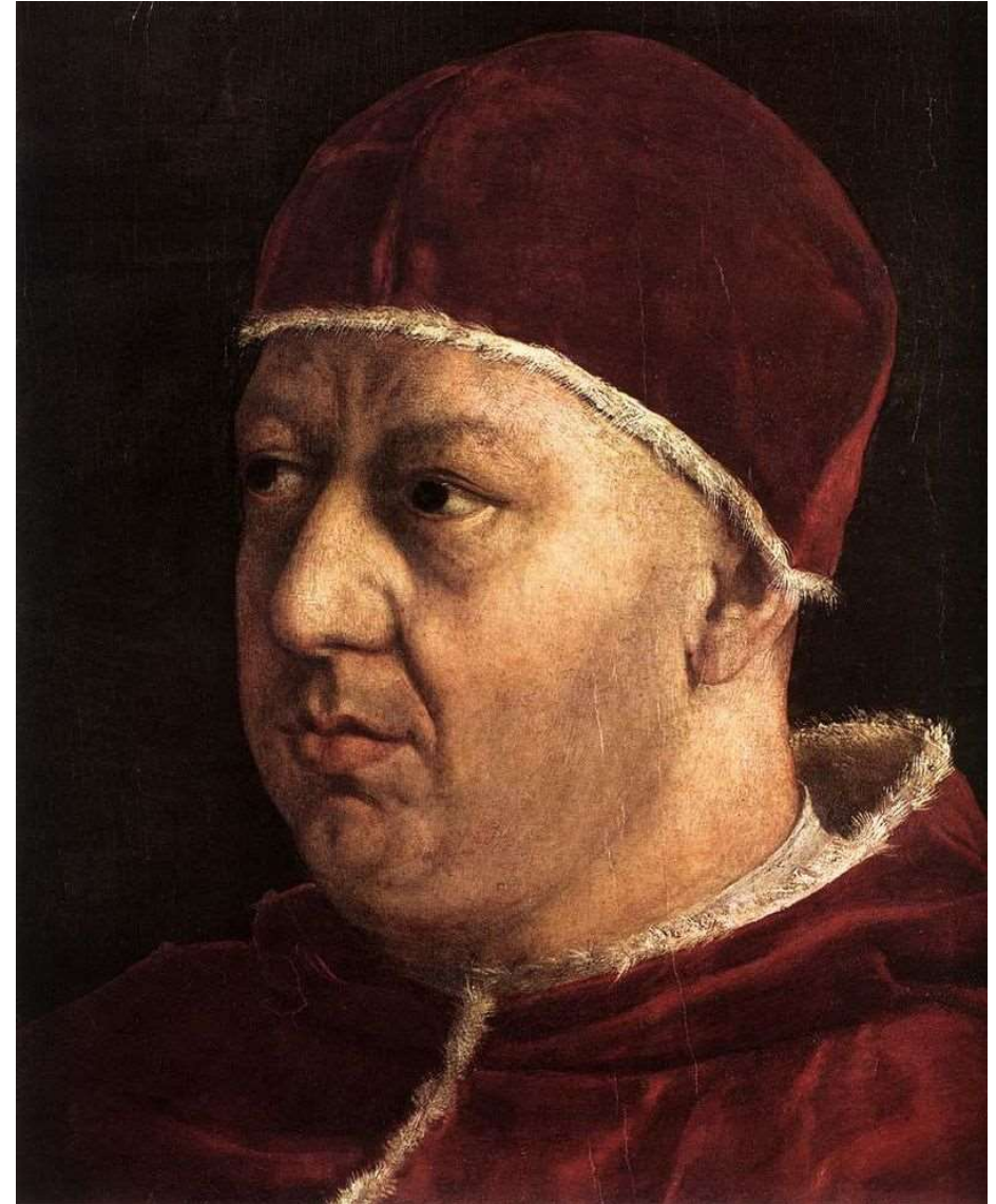
Ritratto di Leone X (particolare, Raffaello Sanzio, 1518-1519, Galleria degli Uffizi)