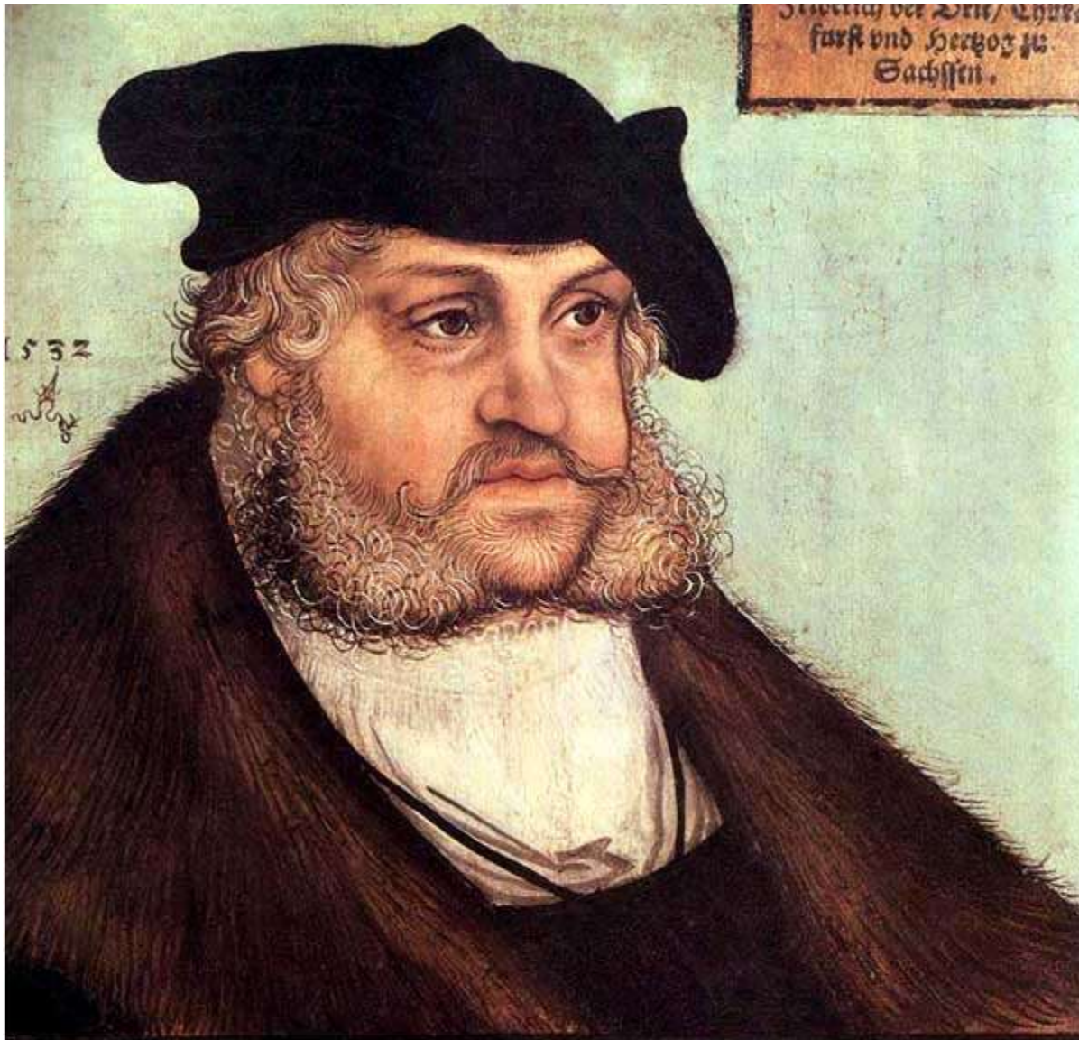
Federico III di Sassonia il saggio di Lucas Cranach il vecchio 1532

b.1) La Riforma diventa una questione politico-religiosa (1520-21) - Il successo di Lutero si deve all'appoggio di numerosi teologi e umanisti, di condottieri militari e del suo sovrano, Federico il Saggio, principe elettore di Sassonia (uno dei più importanti del Sacro Romano Impero). Anche l' Università di Wittenberg