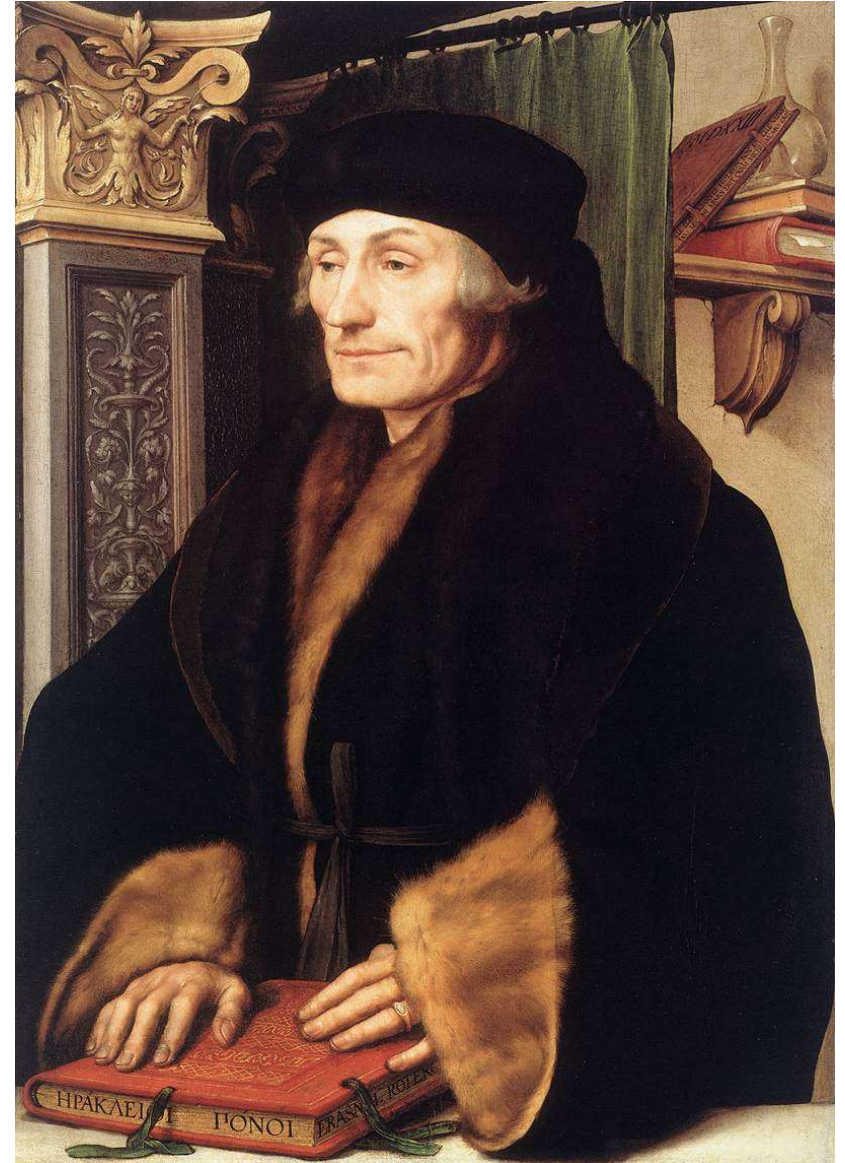
Erasmus di Rotterdam, ritratto da Hans Holbein (1523).

fiducia o si trova il dubbio, allora l'opera non è buona, anche se risuscita tutti i morti e si lascia bruciare vivo". Così si cade nel soggettivismo che è un difetto dell'intera costruzione teologica luterana (quello che, secondo me, piace a Dio può essere l'opposto che credi tu). • Anche se queste idee erano presenti nel 1518, nel 1524 Erasmus di Rotterdam decise di uscire dalla sua posizione ambigua nei confronti di Lutero (all'inizio lo aveva applaudito). Negare il libero arbitrio era troppo per il prestigioso umanista olandese, il più