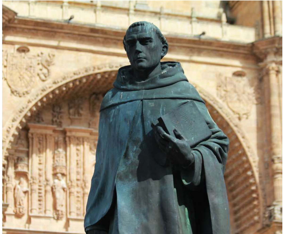
Statua di Francisco de Vitoria nell'Università di Salamanca.

- Teologo di grande autorità, dimostra libertà e coraggio inauditi nel questionare il potere del papa come "dominus orbis", contestando di fatto la legittimità della donazione dell'America alla Spagna e di tutta la conquista .