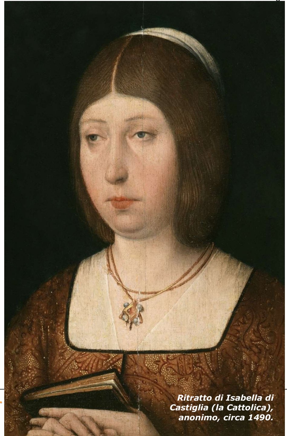
Ritratto di Isabella di Castiglia (la Cattolica), anonimo, circa 1490.

Di conseguenza supplico al Re, mio signore, (...) che così lo facciano e compiano, e che questo sia il loro principale fine, e che in esso impieghino molta diligenza e non tollerino né consentano che gli Indios (...) ricevano alcuna offesa nelle loro persone o beni, ma comandino che siano trattati bene e con giustizia, e se qualche offesa hanno ricevuto, pongano rimedio».