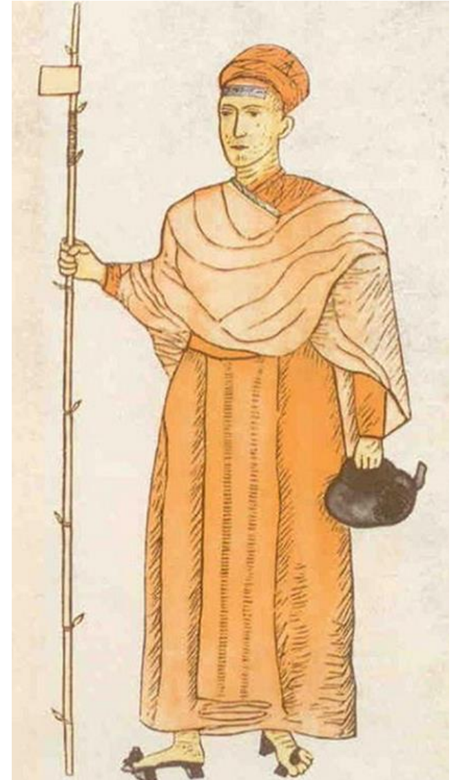
Roberto de Nobili, nelle vesti di bramino.