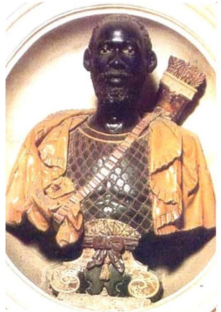
Antonio Emanuele Ne Vunda venne dal Papa come ambasciatore del Re del Congo (1608). Battistero di S. Maria Maggiore, Roma.