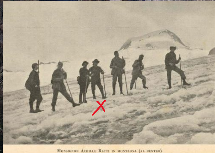
MONSIGNOR ACHILLE RATTI IN MONTAGNA (AL CENTRO)

Parete Est del M. Rosa (4.638 m.), la parete più alta delle Alpi, e l'unica di tipo himalayano. Scalata da Achille Ratti con l'amico sacerdote Luigi Grasselli e due guide. È la prima cordata italiana a farla. Siamo nel 1889.