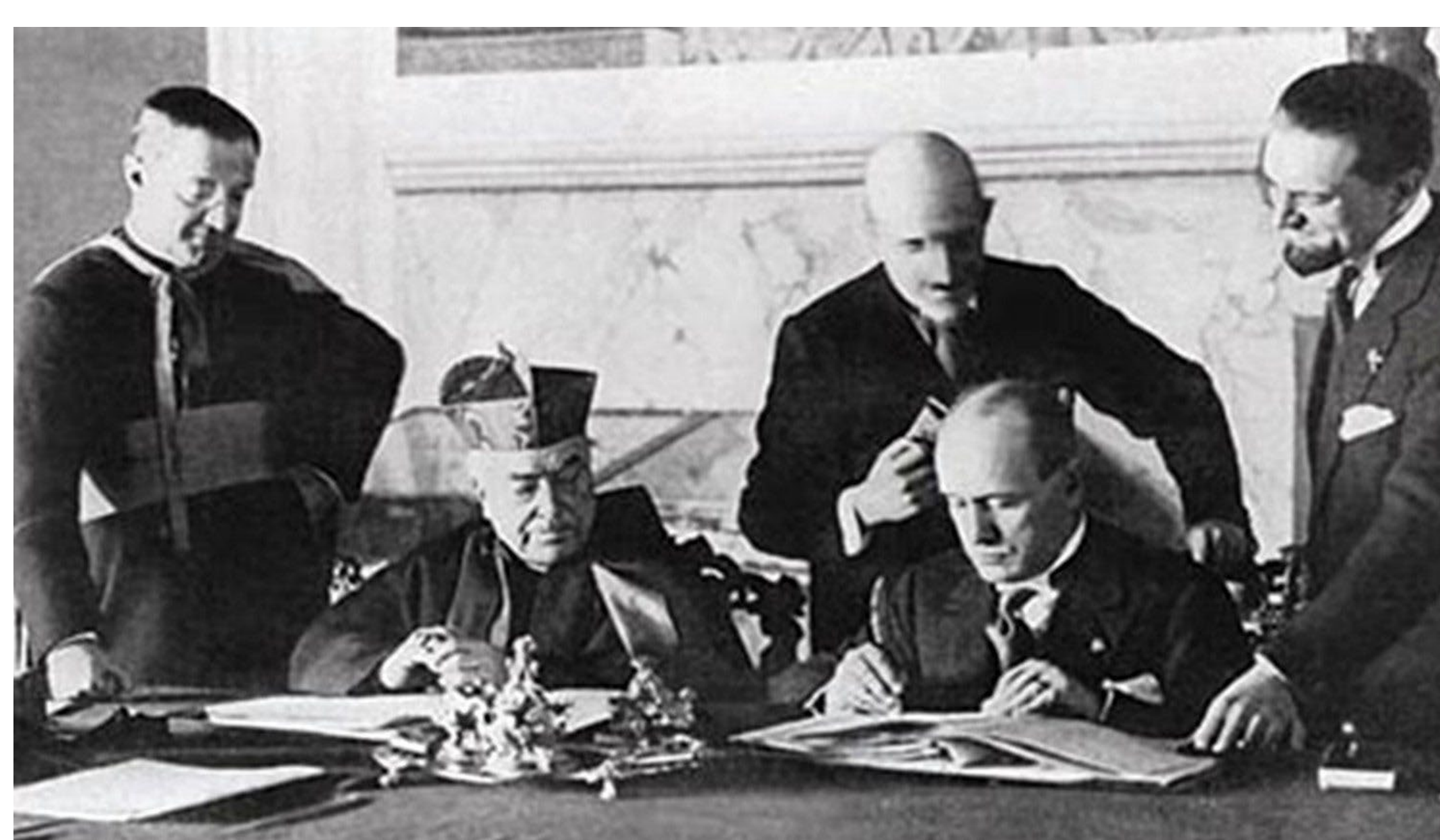
Il Card. Gasparri, Segretario di Stato vaticano, e il Presidente del Governo italiano Benito Mussolini, firmano i Patti Lateranensi (11 febbraio 1929).