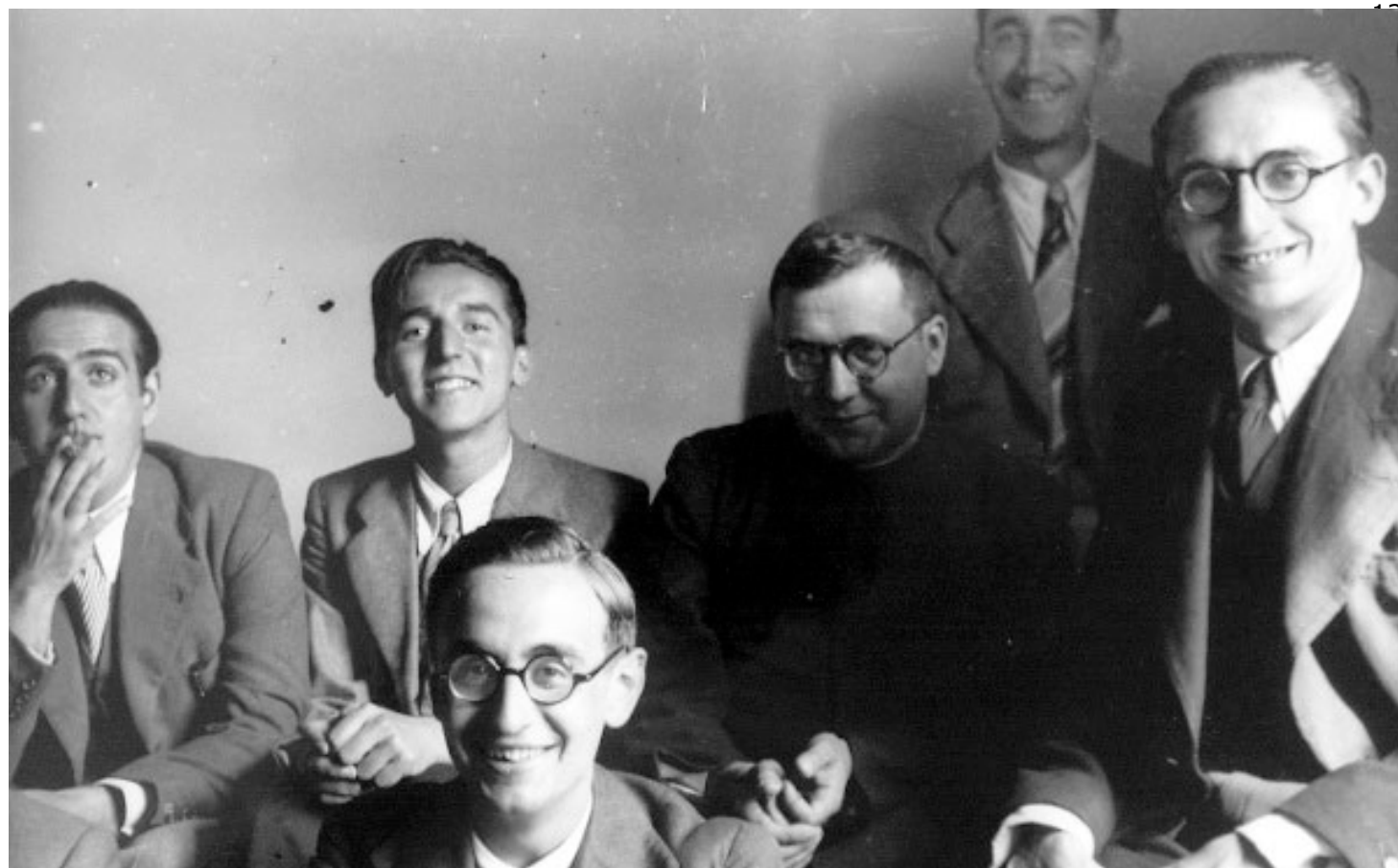
San Josemaría, nel 1940, con un gruppo di membri e di amici dell'Opus Dei.

- Un carisma non si esaurisce nella fondazione di una istituzione, che ha come missione offrire assistenza pastorale personalizzata a chi cerca di vivere secondo quanto descritto in Lumen gentium 31. Va oltre, perché sensibilizza e feconda anche chi è fuori