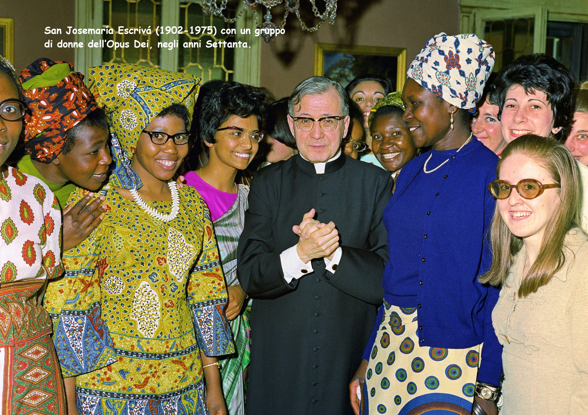
San Josemaría Escrivá (1902-1975) con un gruppo di donne dell'Opus Dei, negli anni Settanta.